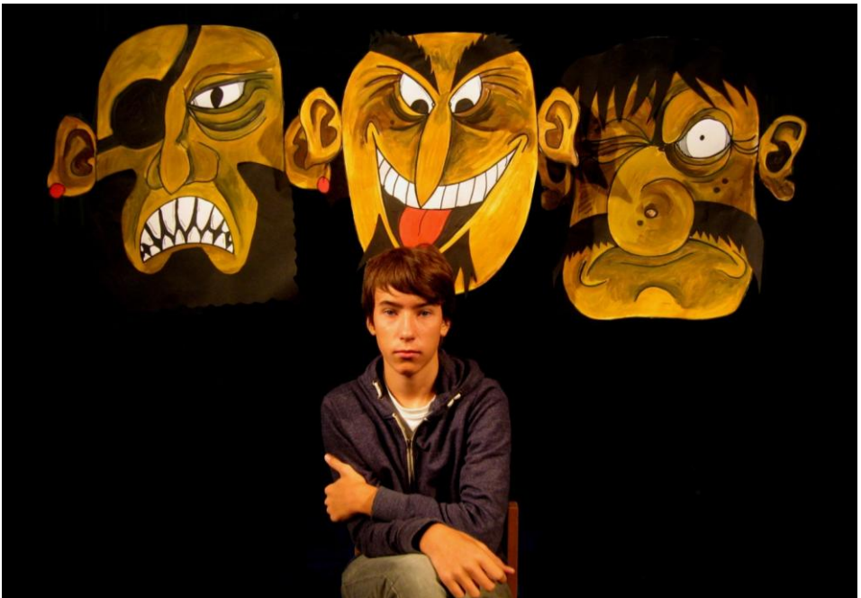
Um „Masken“ ging es auch bei unserem Einschulungsgottesdienst 2015

Bis dahin vertraue ich, dass Gottes Segen uns auch hinter den Masken erreicht. D.R.