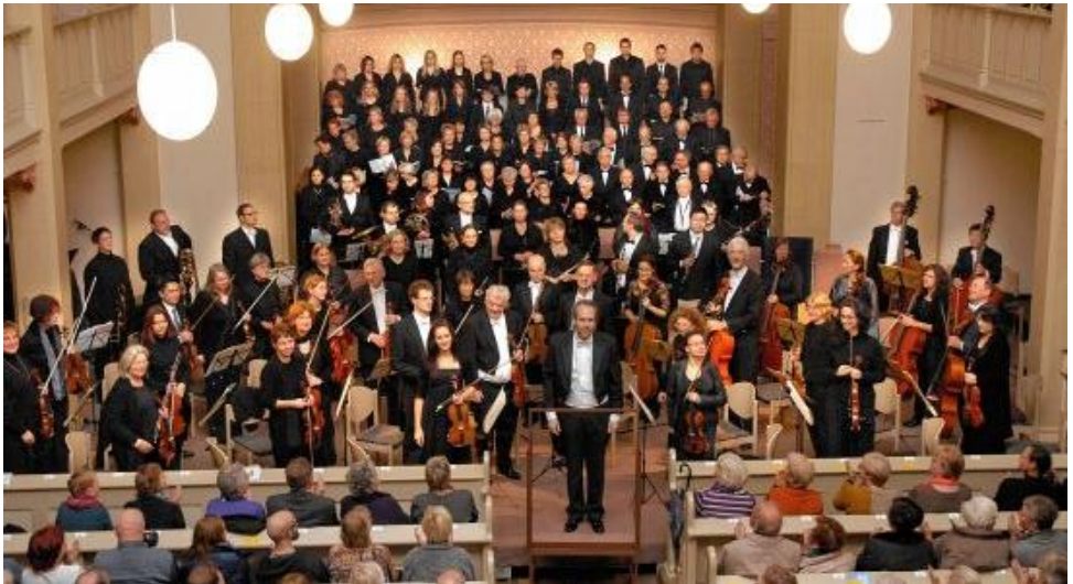
Evangelischer Kirchenchor, Chor der Stadt Löbau und Oekumenische Philharmonie führen Deutsches Requiem von Brahms auf

Mit 42 Sängerinnen und Sängern begeht der Kirchenchor in diesem Jahr seinen 120. Geburtstag. Mit einem Konzert am 24. April 2016 in unserer Kirche werden 120 Jahre Chorgeschichte geschrieben. U. M.