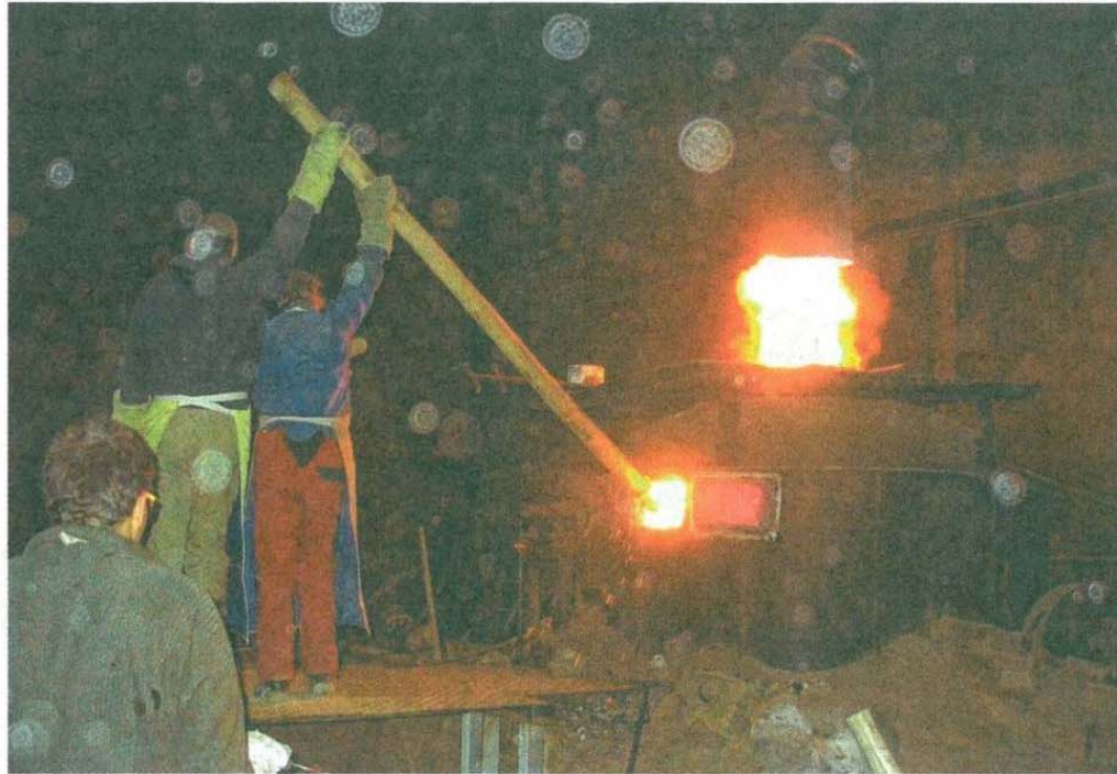
Mit einem Holzpfahl wird der Bronzebrei im glühenden Ofen gerührt. Anhand einer Probe erkennt der Fachmann, ob die Mischung reif zum Guss ist. Alles beruht auf Wissen und Erfahrung.

Erst wenn alle Voraussetzungen stimmen, kommt der große Moment: Der Mann am Schmelzofen wartet auf die Anweisung des Meisters, den Zapfen, mit dem die Glut zurückgehalten wird, zu durchstoßen. Nachdem der Ofen geöffnet wurde, beginnt ein Feuerzauber, der seinesgleichen sucht. Wie glühende Lava bahnt sich die Glockenspeise den Weg durch die Rinnen und wird von den Glockengießern aufgehalten, wenn die Formen gefüllt sind.